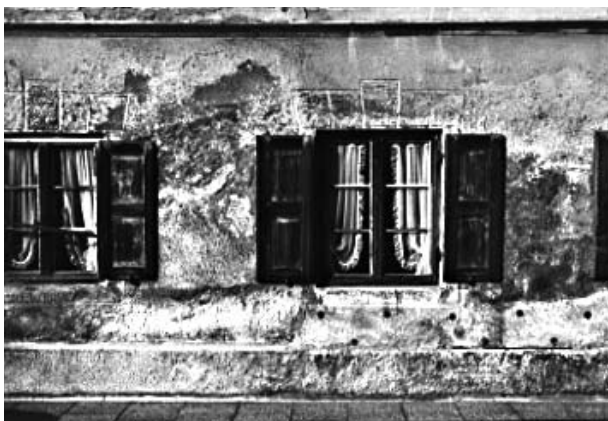
Bild 1: Bauernhaus mit 45 cm dicken Tuffsteinwänden und sichtbar "aufsteigender" Feuchte, gegen die früher schon einmal "Entfeuchungsröhrchen" eingebaut worden sind. In Wirklichkeit haben Messungen einen erhöhten Salzgehalt im Außenputz ergeben, nach [1].

Aufsteigende Feuchte wird in Verbindung mit den Abhilfemaßnahmen Drainage, Horizontalsperre oder Injektionen viel häufiger als Schadensursache diskutiert, als sie in der Praxis